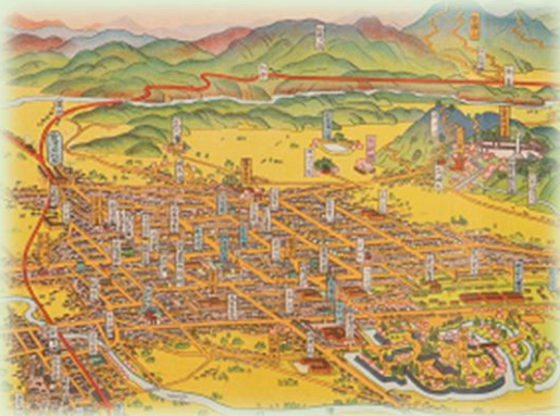
『会津若松市 会津若松市及附近案内図』 (部分) 若松市役所／編、青木 志満六／画 昭和8(1933)年

令和6年1月24日より、会津若松市デジタルアーカイブに会津図書館所蔵の古文書(3点)、絵図(4点)、鳥瞰図(7点)の画像を追加公開します。ご自宅のパソコンやスマートフォンから簡単な操作で画像を拡大・縮小して見ることができます。一部資料を除き、画像データをダウンロードし、印刷も可能です。ぜひ、ご覧ください。