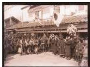
「彼岸獅子舞」(馬場町) 今から104年前の大正7年3月に撮影された写真です。彼岸獅子を見ようと商家の軒先に多くの人々が集まっています。当時の服装にも注目です。