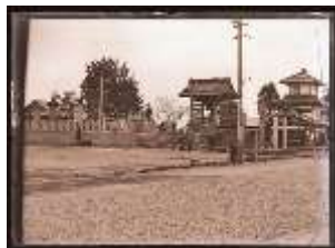
「阿弥陀寺」(七日町) 御三階の左側に、大仏様が写っています。大仏様は太平洋戦争の金属供出にあい、台座のみ残されています。御三階の場所も現在とは違ってありますね。

会津若松市内を中心に変わりゆく街並みや鶴ヶ城、東山温泉、飯盛山などの観光地、神社仏閣などの写真と絵はがきを公開します。明治・大正・昭和戦前の時代を感じてみませんか。※画像は順次追加予定です。