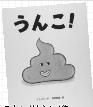
「うんこ!」サトシン/作 西村敏雄/絵 文溪堂/刊