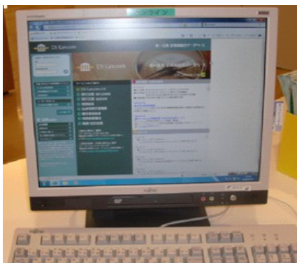
★ 「第一法規法情報総合データベース」